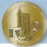
Médaille souvenir, en vente sur place : 6 €

Vous pourrez aussi profiter des effluves du printemps dans la Montagnette chère à Daudet et à Mistral et monter jusqu'à l'abbaye Saint-Michel-de-Frigolet (Pâques-en-Provence 1959), la visiter et, pourquoi pas, goûter le fameux élixir du révérend-père Gaucher. Les collines qui environnent l'abbaye, sillonnées de nombreuses pistes, font le bonheur des marcheurs et des vététistes.